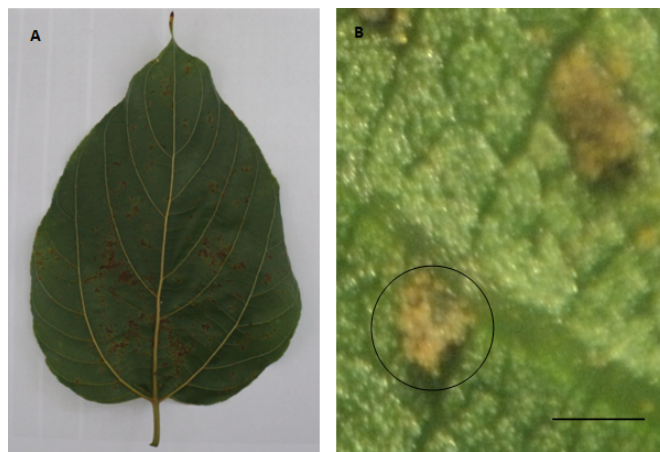
Figura 1. (a) folha apresentando sintomas necróticos e pústulas decorrentes da ação da ferrugem da uva-do-japão. (b) massa de urediniósporos em pústulas da ferrugem da uva-do-japão. Barras = 2 mm

No Brasil, a primeira ocorrência do fungo em uva-do-japão, foi detectada em 1948, no município de Taquari no Rio Grande do Sul, por Lindquist & Costa Neto, através do seu anamorfo Uredo hoveniae [7]. Outros trabalhos também descrevem a ocorrência deste fungo: sobre Hovenia dulcis na Reserva Florestal Armando de Salles Oliveira, São Paulo [3], e sobre Colubrina rufa e Hovenia dulcis em área de cerrado no município de Mogi Mirim no Estado de São Paulo [4].