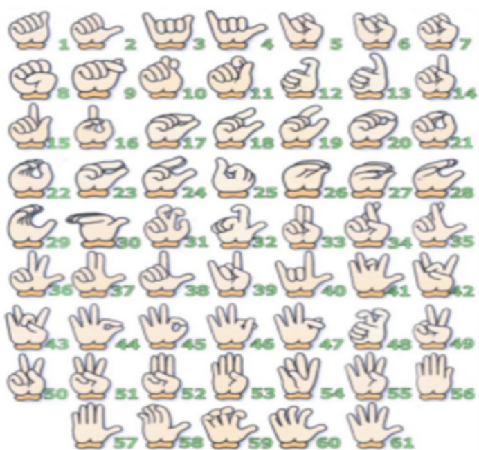
Figura 1. Imagens das 61 configurações de mão da LIBRAS 1 .

râmetro primitivo para realização de qualquer sinal da LIBRAS. Pode ser a mesma ou variar para outra configuração de mão durante a execução de um sinal, ou seja, existem sinais que são constituídos por mais de uma configuração de mão [22].