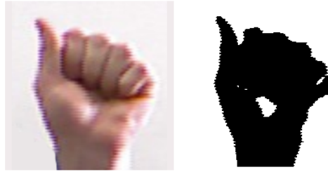
Figura 3. Limiarização aplicada à imagem da Base de Dados.

Utilizando a técnica de características estruturais, que consiste em “calcular alguns histogramas para formar o vetor de características”, segundo Cruz [24], a imagem foi normalizada para uma matriz de tamanho 200x200 pixels. Em seguida são calculadas as projeções de histogramas horizontal e vertical.