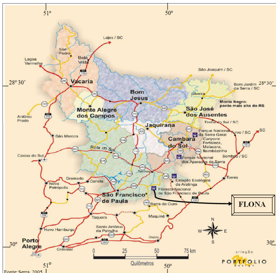
Figura 2. Localização do município de São Francisco de Paula e da FLONA de São Francisco de Paula (RS)

Renováveis (IBAMA), está localizada no Distrito de Rincão dos Kröeff, município de São Francisco de Paula (RS), entre as coordenadas geográficas 29° 23' e 29° 28' de latitude Sul e 50° 23' e 50° 25' de longitude Oeste, na Serra Gaúcha, região Nordeste do Estado, (Figura 2) a uma altitude média de 930 m (IBAMA, 2000).