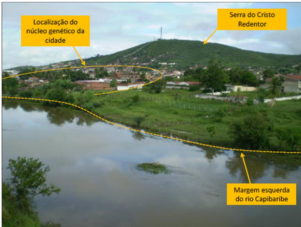
Figura 2 - Localização do núcleo genético da cidade de Limoeiro entre a vertente sul da Serra do Cristo Redentor e a margem esquerda do rio Capibaribe