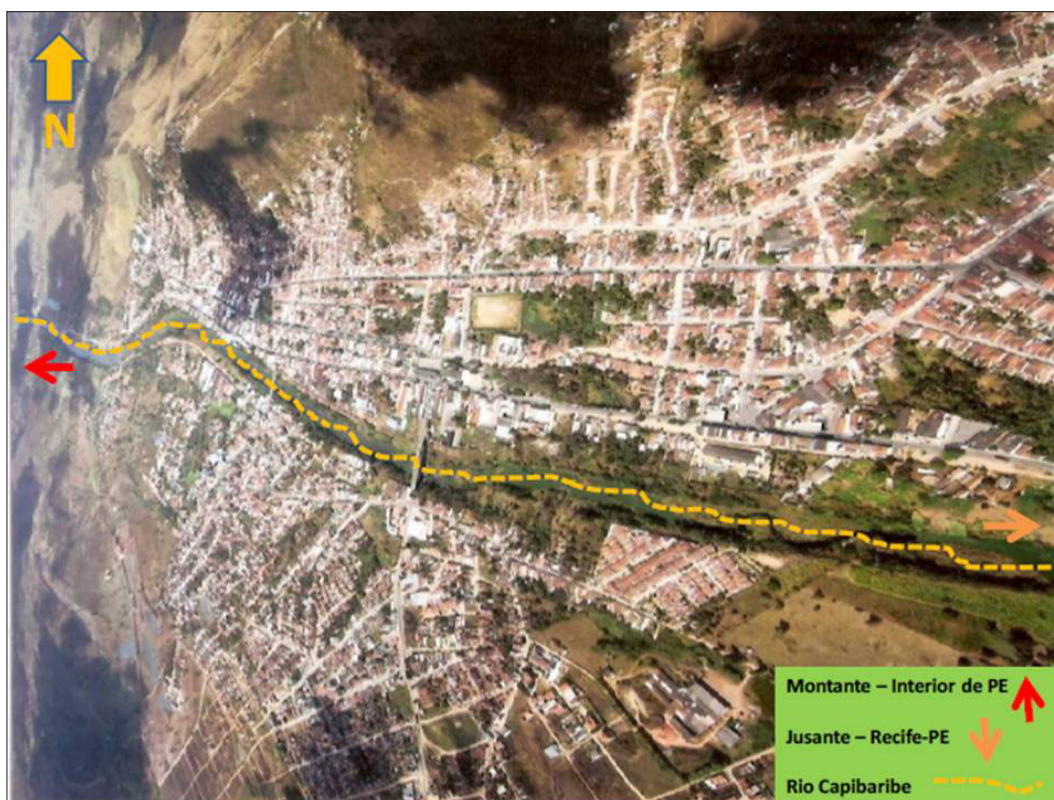
Figura 1 – A cidade de Limoeiro às margens do rio Capibaribe - Pernambuco

A formação da cidade ocorreu a partir da atuação da Igreja Católica mediada pelos padres jesuítas na catequização dos indígenas. O uso agrícola dos solos entre a serra do Cristo Redentor (Figura 2) e a margem esquerda do rio Capibaribe é uma das primeiras atividades implementadas no espaço sobre o qual está a cidade atualmente (VILAÇA, 1971).