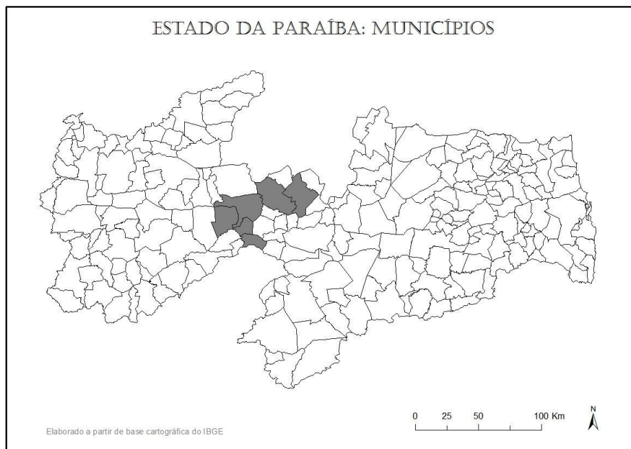
Figura 1 - Localização da área de estudo no Estado da Paraíba