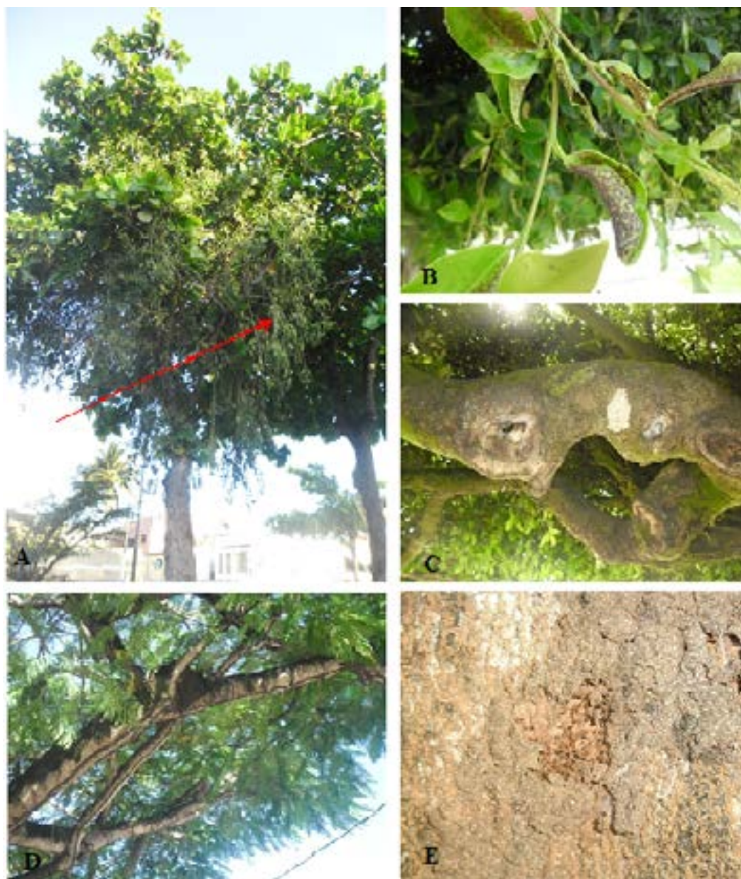
Figura 4- (A) Indivíduo Terminalia catappa infestado por erva de passarinho ( Tripodanthus acutifolius (Ruiz & Pav.); (B) Ficus com folhas atacadas por lacerdinha ( Thrips sp); (C) Ficus com tronco com ocorrência de poda severa e lesionado pela ação de insetos broqueadores; (D e E) Ataque de cupins em Delonix regia .