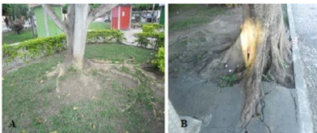
Figura 6- (A) Erythrina indica em canteiro proporcional ao seu desenvolvimento; (b) problema provocado pela superficialidade de raiz de Ficus .