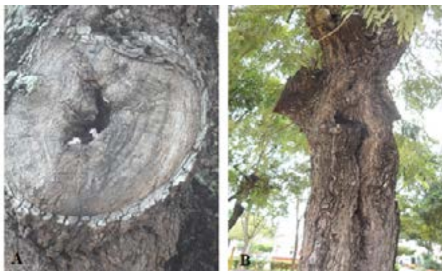
Figura 8- podas severas executadas em indivíduos arbóreos presentes em praças de Alagoinhas, BA. (A) Mangifera indica ; (D) Senna siamea .

Fonte: Banco de dados dos autores (2014).