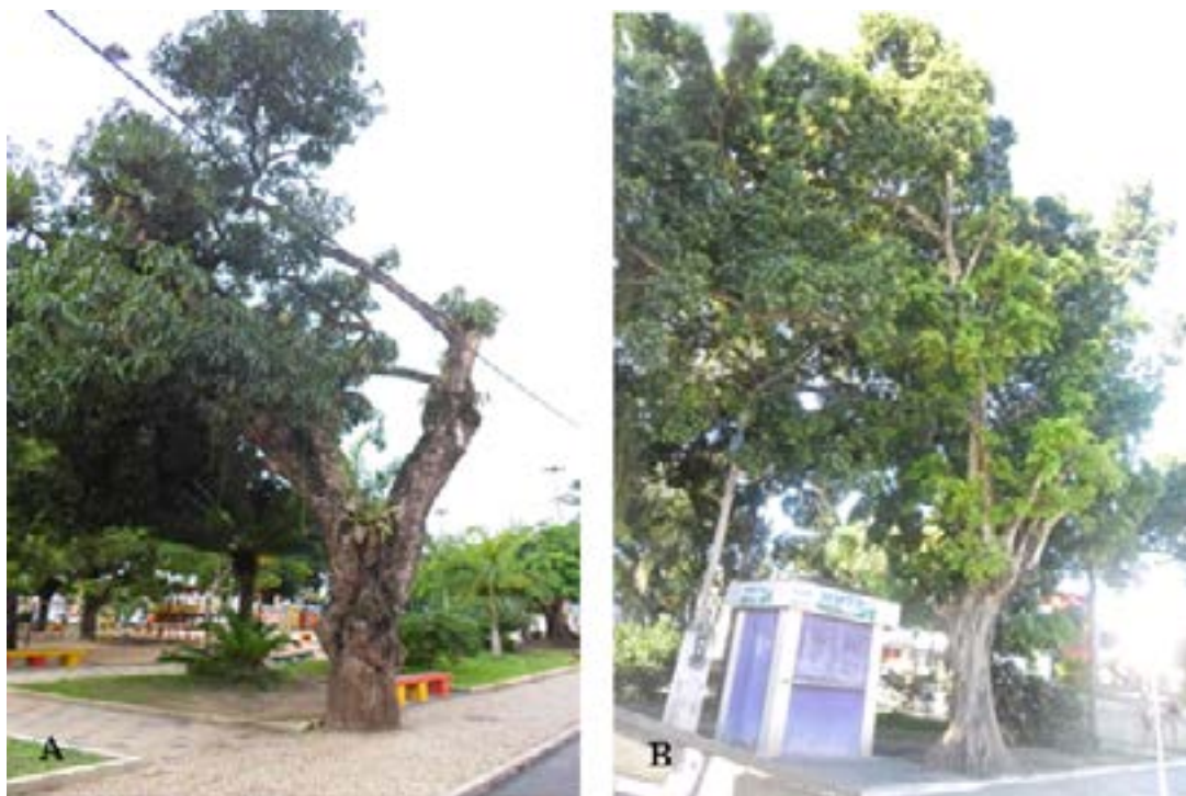
Figura 3- Indivíduos arbóreos desequilibrados pela poda severa na Praça Rui Barbosa. (A) Mangifera indica (B) Ficus .