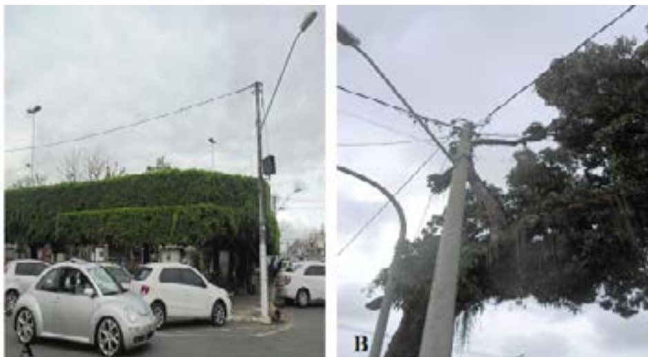
Figura 7- (A) Indivíduos de Ficus podados frequentemente (podas de segurança) para evitar contato com a rede elétrica e para o embelezamento da Praça J.J. Seabra; (B) Execução de poda severa em Mangifera indica que encontrava-se em contato com a rede elétrica na Praça Rui Barbosa: