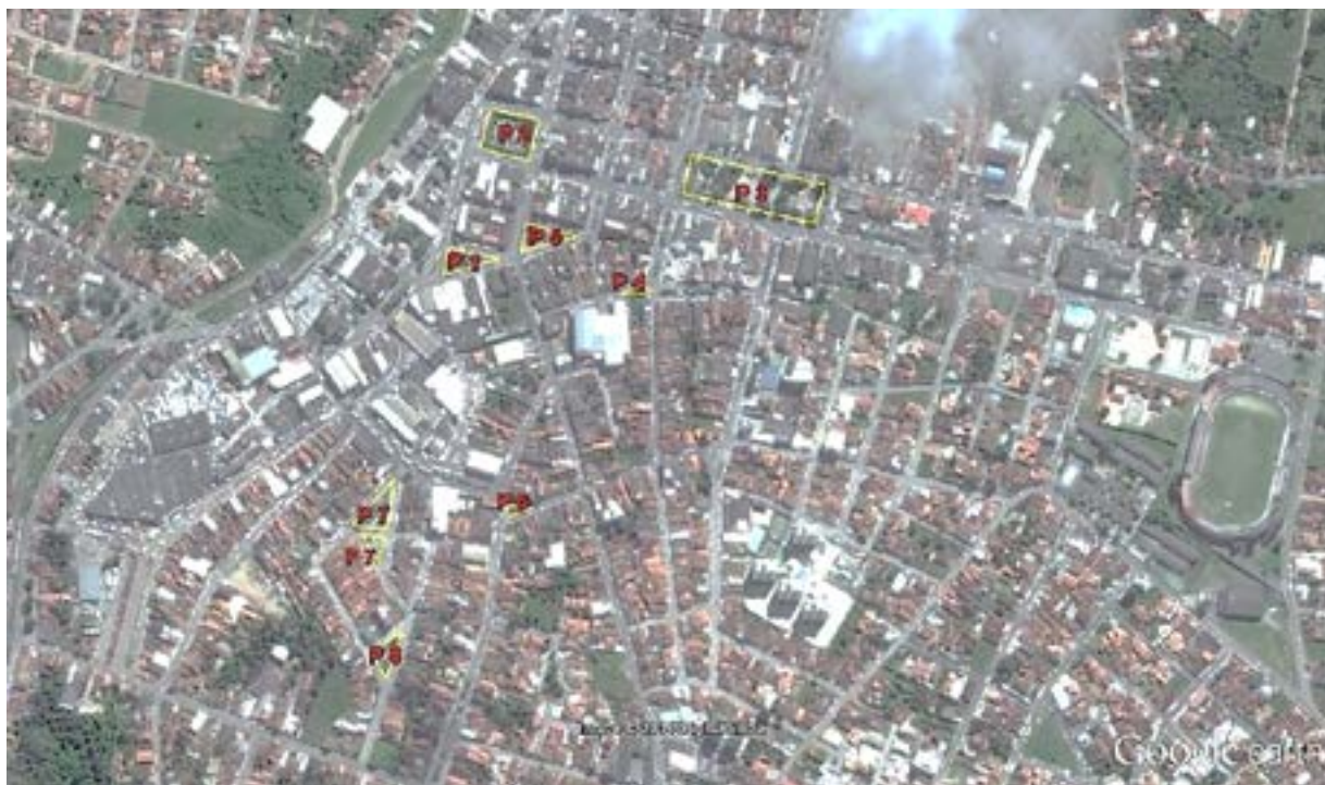
Figura 1- Imagem de satélite do centro de Alagoinhas-BA, com destaque na Localização das Praças Estudadas. P1-Praça da Bandeira; P2-Praça J.J. Seabra; P3-Praça Rui Barbosa; P4-Praça Conselheiro Couto; P5-Praça Castro Leal; P6-Praça Sete de Setembro; P7-Praça do Oito; P8-Praça Aristides Maltez.