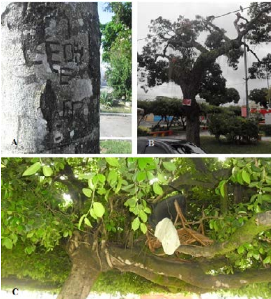
Figura 5- Principais injúrias provocadas nos indivíduos arbóreos presentes em 8 praças em Alagoinhas, BA. (A) Clitoria fairchildiana na Praça do Oito com cortes no tronco; (B) Indivíduo de Mangifera indica na Praça Rui Barbosa, com placa fixada; (C) Uso do indivíduo Ficus na Praça J.J. Seabra para guardar objetos (cadeiras e placa).