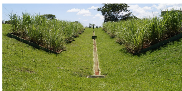
Figura 1 – Bacia Hidrográfica Experimental, FCAV/UNESP

com 40% de declividade e exposição norte), e 40S (superfície com 40% de declividade e exposição sul). Nas superfícies da área experimental foi plantada a variedade de cana-de-açúcar RB855453.