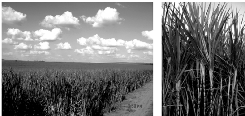
Figura 2. Canavial em plena maturação e detalhe da variedade RB835486