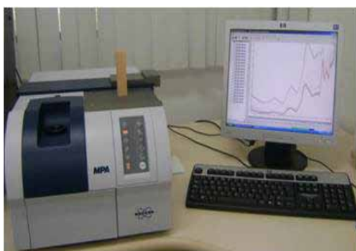
Figura 1. Espectrômetro Bruker utilizado na aquisição dos espectros

Os corpos-de-prova foram mantidos em sala climatizada até a estabilização da umidade. O teor de umidade médio dos corpos-de-prova, (umidade base seca), antes da coleta dos espectros foi de aproximadamente 13%. A aquisição espectral foi realizada em sala climatizada, com temperatura média de 18^{\circ}\text{C} e umidade relativa próxima de 57%. Os espectros foram obtidos em três diferentes pontos do corpo-de-prova, sendo uma leitura obtida na face radial (Rd), uma leitura na face tangencial (Tg) e uma leitura na face transversal (Tr). As leituras foram realizadas no centro de cada