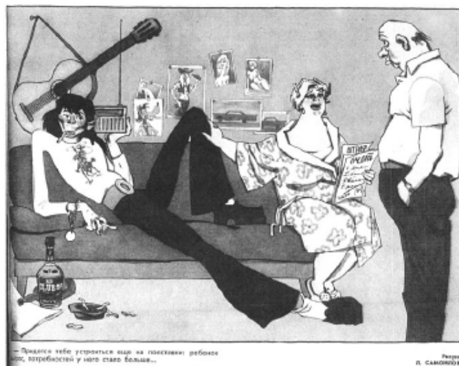
Figura 1: “Eu não quero ABBA! Quero um jeans da moda!”

Fonte: Revista Krokodil, 1974-81. CHERNYSHOVA, Natalya. Soviet consumer culture in the Brezhnev era . Nova York: Routledge, 2013, p.128.