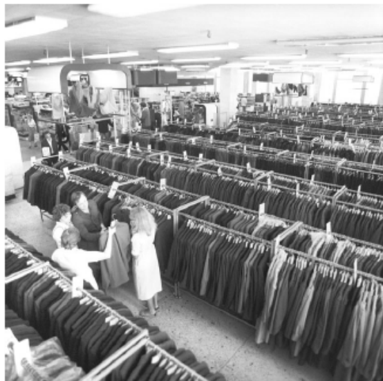
Figura 3: Loja de departamentos em Minsk, Bielorrussia, em 1983.