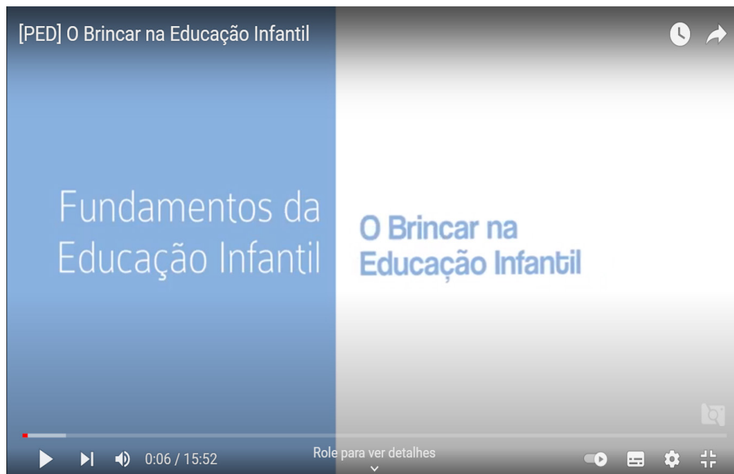
Figura 2 - Imagem de um exemplo da videoaula no canal do Nead/Unicentro do curso de Pedagogia.