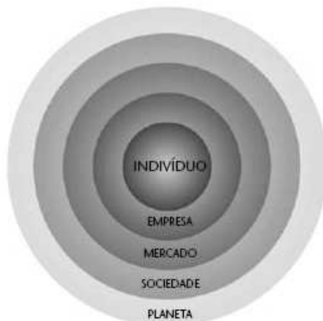
Figura 2: Biograma de gestão responsável para a sustentabilidade

Neste sentido, pode-se evidenciar na Figura 2 a visão de Boechat e Paro (2007) sobre o envolvimento de todos os elementos que influenciam no desenvolvimento sustentável, os quais podem ser claramente expressos em forma de um biograma, que é considerado um sistema vivo de gestão socioambiental que tem o indivíduo como parte central do sistema.