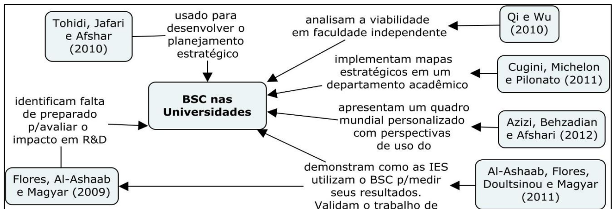
Figura 1. Mapa conceitual da aplicação do BSC nas universidades.

Nota: Apresenta o mapeamento conceitual da dimensão representativa das aplicações do BSC implementado nas universidades.