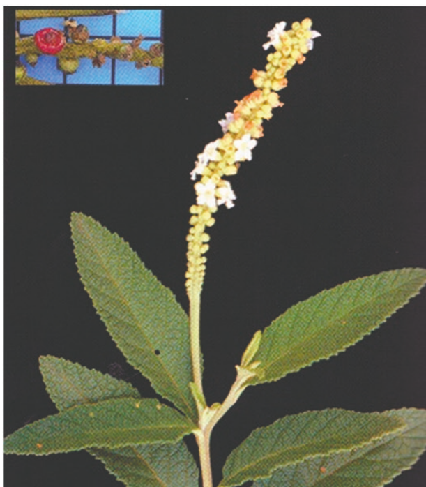
Figura 1. Folhas, inflorescência e frutos (no detalhe) de Varonia curassavica Jacq..

para a reprodução de plantas com características iguais às matrizes originais. Assim, genótipos mais interessantes do ponto de vista de concentração de princípios ativos podem ser multiplicados sem perda de vigor e qualidade (FACHINELLO et al., 2005).