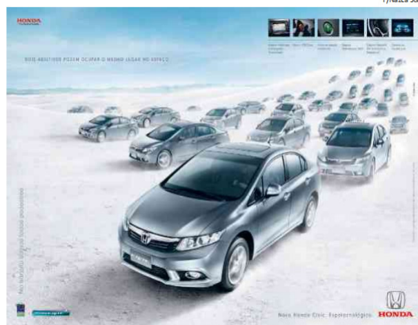
Figura 6. 5ª ocorrência de implícito