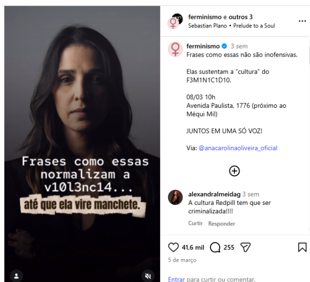
Figura 3: Até que ela vire manchete 8