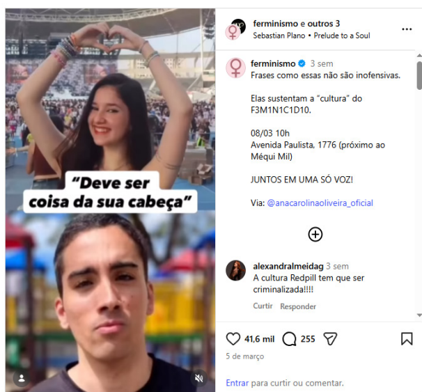
Figura 2: Até que ela vire manchete