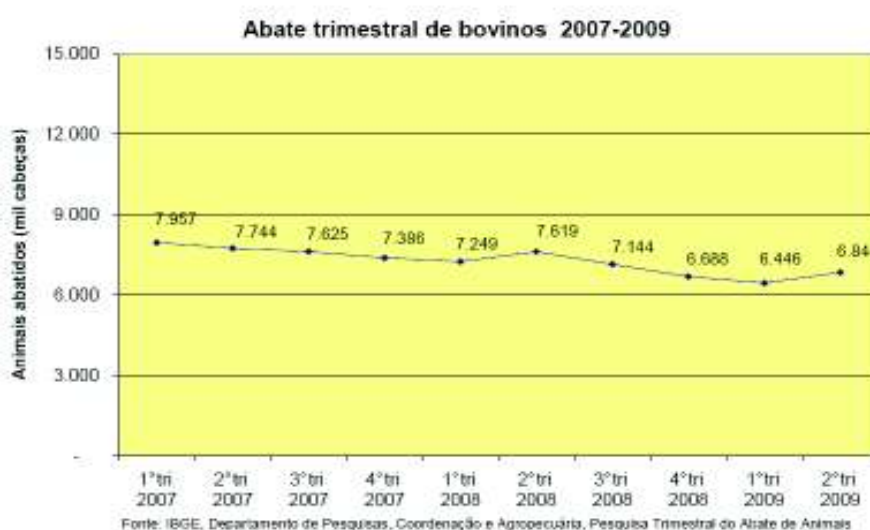
Gráfico 1 – Estudo da quantidade de bovinos abatidos no Brasil durante o dieno 2007-2009 (adaptado 9) )

É de suma importância ressaltar que a pecuária orgânica não dispensa, porém, a vacinação antiaftosa. Os animais são vacinados obedecendo ao calendário estabelecido para o sistema convencional (8) . O controle de qualidade do produto orgânico é realizado por empresas certificadoras, que são pessoas jurídicas, sem fins lucrativos, sediadas no território nacional e credenciadas pelo Órgão Colegiado Nacional, possibilitando o comércio com mercados consumidores de países exigentes como os membros do Mercado Comum Europeu, os Estados Unidos da América, Japão e Suíça (10) .